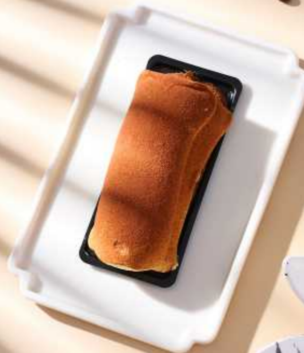
提拉米苏 🍷 ¥58 TIRAMISU